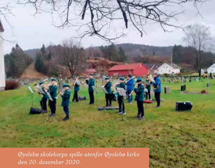
Øyslebø skolekorps spille utenfor Øyslebø kirke den 20. desember 2020.