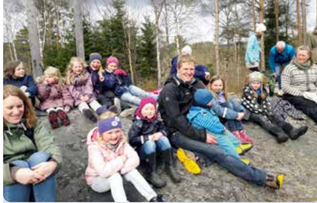
Søndagsskolen på Øyslebø har opprettholdt det meste av aktiviteten i koronaperioden, men savner normale tider. Dette bildet er tatt på en uteaktivitet i Husebakk i 2018.

Vi jobber aktivt for at lederne ikke skal mistet motet, og at de skal få inspirasjon til å starte opp igjen til høsten. Fordi vi ønsker at barna skal få muligheten til å bli kjent med og undre seg over bibelfortellingene, sammen med andre barn og voksne i en barnegruppe.