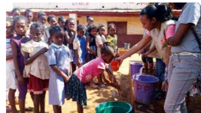
De frivillige i aksjon under hygieneopplæring på skoler i Tsiroanomandidy.