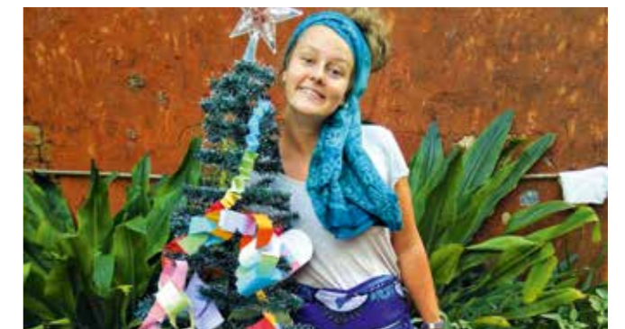
Under julefeiringen kledde Aurora seg opp i tradisjonelle gassiske klær.

Et opphold på fem måneder i en fremmed kultur byr også på noen utfordringer.