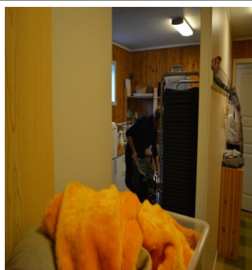
Lager, «kjøkken», «vaskerom» og korridor på få kvadratmeter i tilbygget

Men denne løysinga har også mange ulemper. Kyrkjerommet er ikkje beregna for slik aktivitet og slitasjen både på inventar og medarbeidarar merkast. Saft-, kaffi- og smulesøl kjem overalt, det er ikkje til å unngå. Mange ønsker seg bord og stolar til å setje seg ned. Benkane er svært lite eigna for kaffikoppar og slikt. Og kjøkkenfasilitetane kan ikkje kallast eit kjøkken etter vanlege definisjonar. «Kjøkkenet» er på eit lager, som også fungerer som «vaskerom» og pressar kapasiteten i kyrkja sitt tilbygg til det ytterste, i tillegg til problemstillingane nemnt ovanfor. Eit tidlegare toalett for medarbeidarar har vorte teke i bruk som lager for musikklegg og instrument.