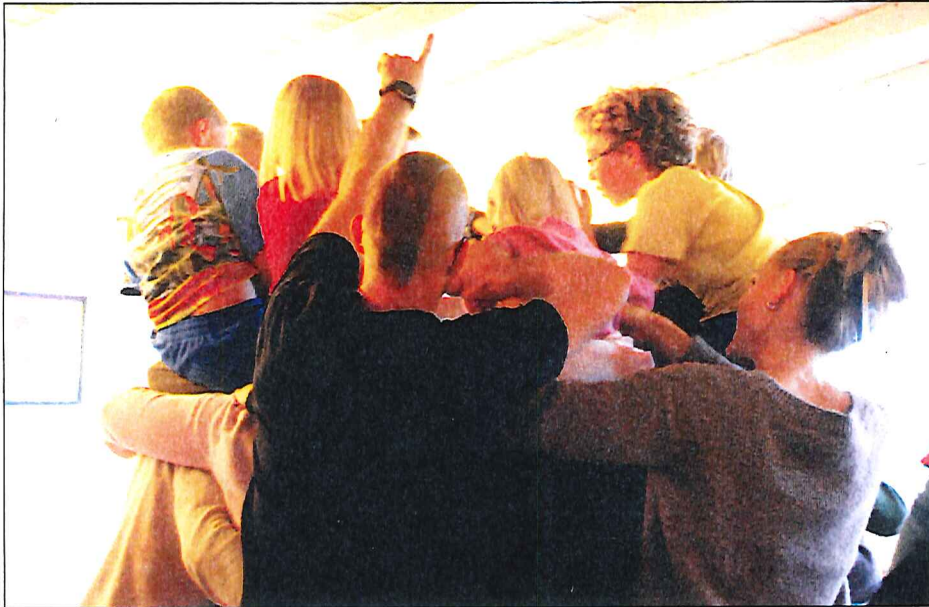
Barn og vaksne byggjer kyrkjelyd saman.