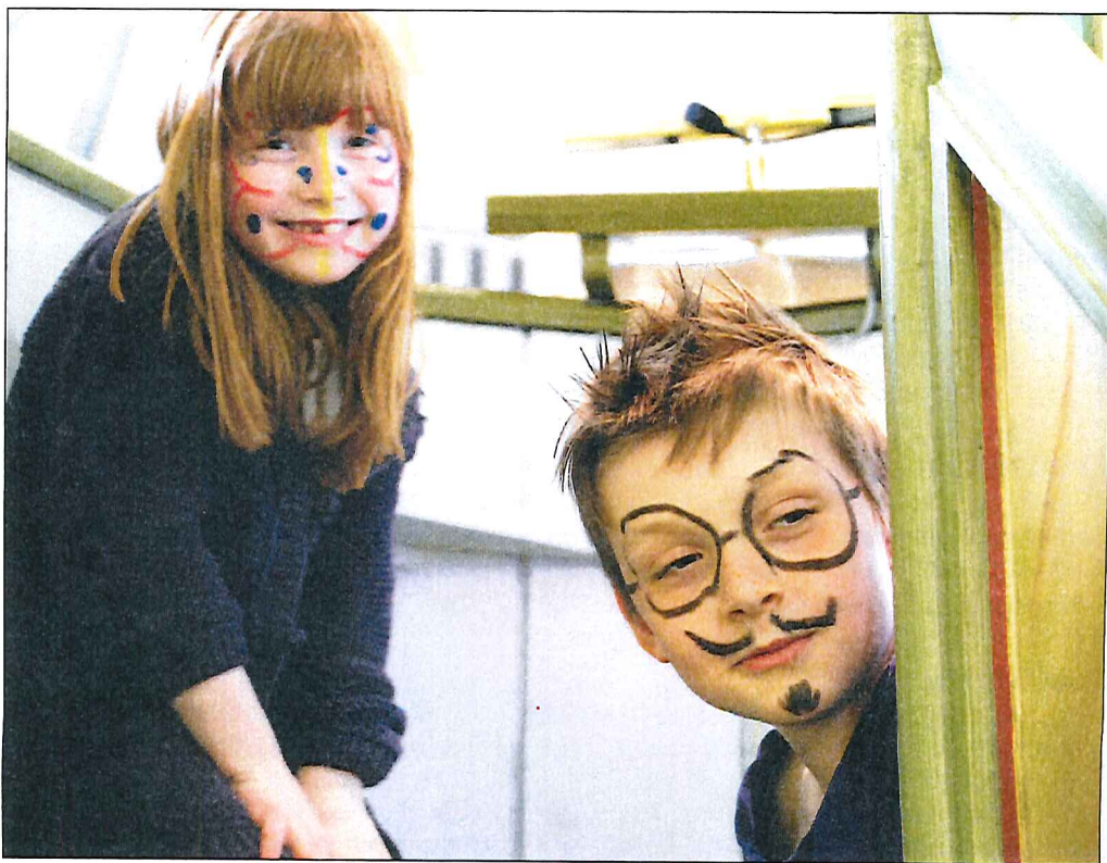
To fra Løvegjengen (søndagsskulen) i aksjon i preikestolen.