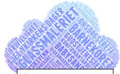
Skatter i Jeløy menighet

Vi er godt inne i menighetsuviklingsprosjektet i regi av bispedømmet. Arbeidet vil munne ut i et strategidokument som skal legges frem for menighetsrådet. Dette er tenkt å gi en hjelp til det videre arbeidet i og for kirken vår.