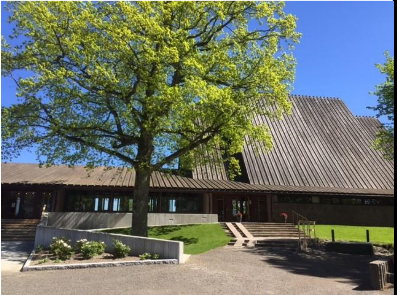
Jeløy kirke mai 2017