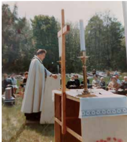
Biskop Per Lønning.

Men det skulle gå hele to år før bystyret bifalte opprettelsen av egen menighet. I bystyremøtet 20.november 1962 ble delingen enstemmig vedtatt. Det ble samtidig vedtatt å bevilge kr 50 000