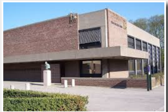
Den katolske kirke.