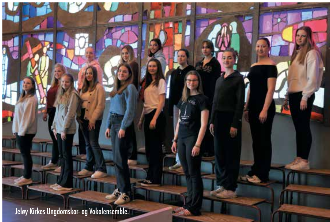
Jeløy Kirkes Ungdomskor- og Vokalensemble.