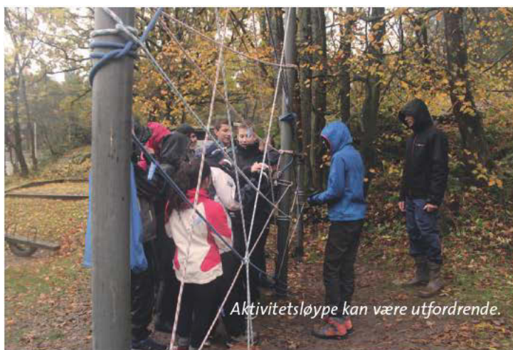
Aktivitetssløype kan være utfordrende.

Fredag kveld besto av kveldsmat, leker, konkurranser, quiz og kveldsavslutning med lystenning, stillhet, bønn og ettertanke.