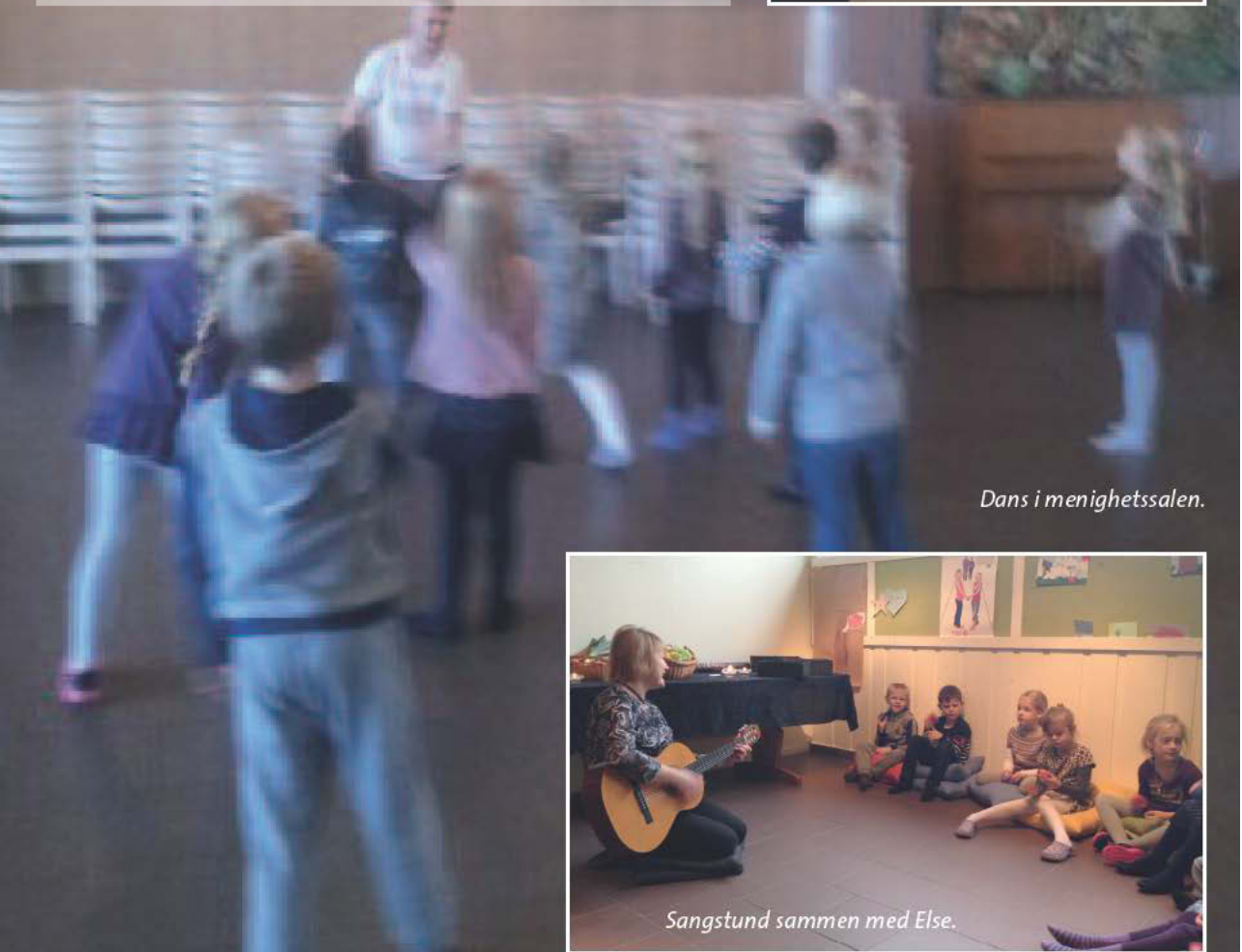
Dans i menighetssalen.