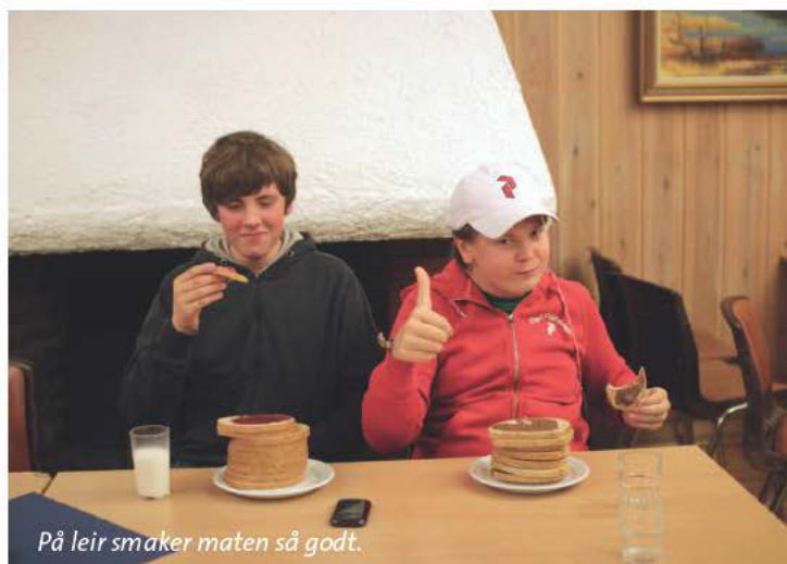
På leir smaker maten så godt.

Konfirmanter og ledere hadde en hyggelig leir. Leir er gøy!!!