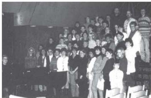
Faksimile fra Jeløy menighetsblad nr 2 1995.