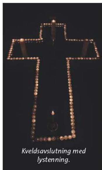
Kveldsavslutning med lystenning.

'Talentkveld' sto på programmet lørdag kveld. Flere av konfirmantene viste sine sang-, danse- og musikalske talenter. Flotte talenter alle sammen. Lørdagskvelden ble også