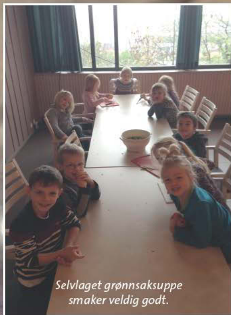
Selvlaget grønnsaksuppe smaker veldig godt.

Selv om det var grått og tåkete vær ute, hadde vi en superfin innedag i kirken med lys, glede og moro!