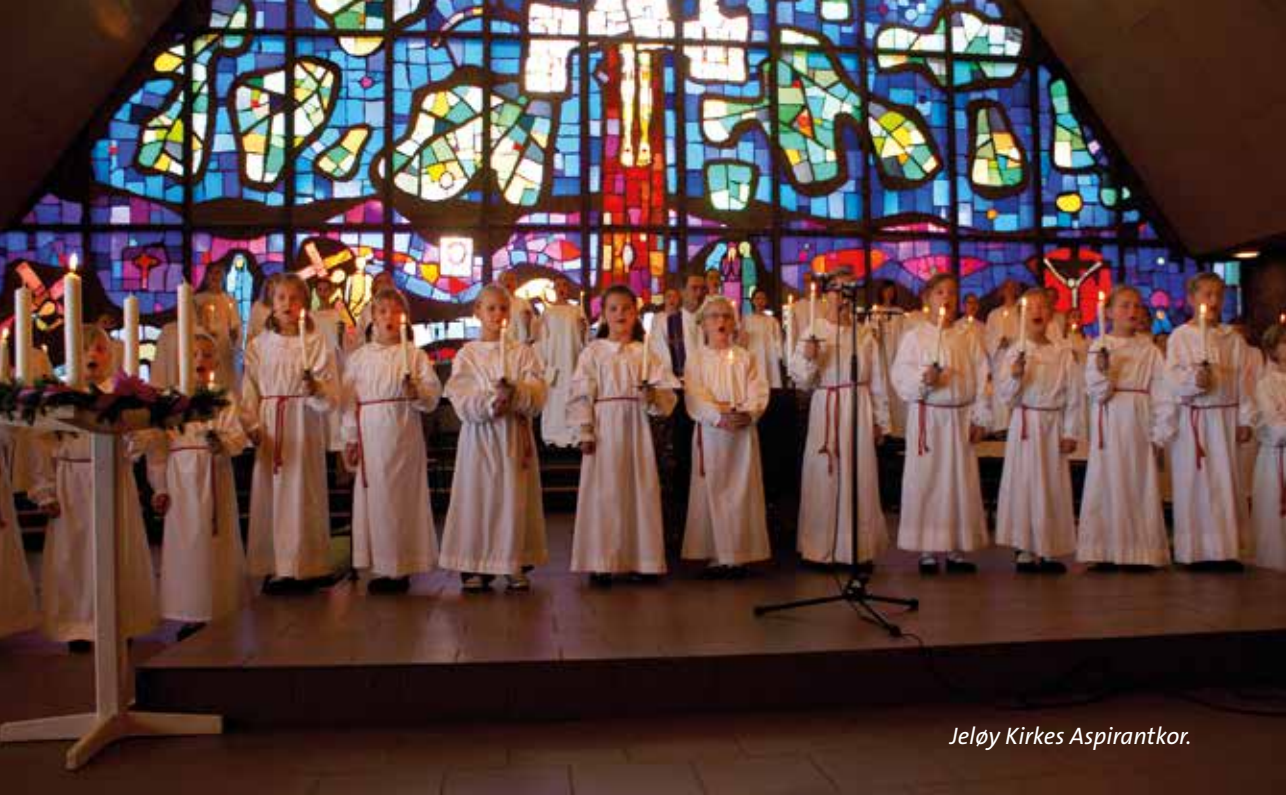
Jeløy Kirkes Aspirantkor.

Nå øver dere på julesangene – gleder dere dere til jul? JAAA! lyder det i kor! - Jeg gleder meg til alle gavene! - Jeg gleder meg til julesangene på konsertene. - Julesangene skal vi kunne vi utenat! - Og det å lære nye julesanger er lett! Det er bare å øve - så kan vi dem etter hvert helt utenat!