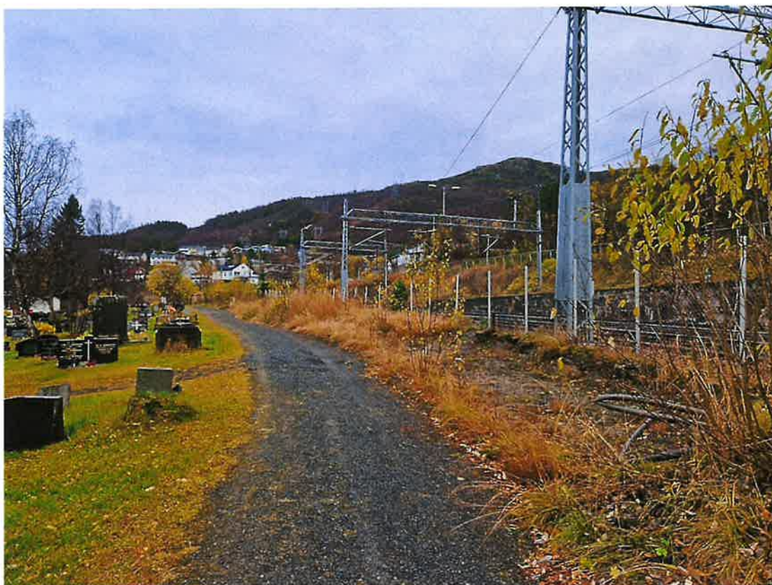
Bilder tatt 13 oktober 2022