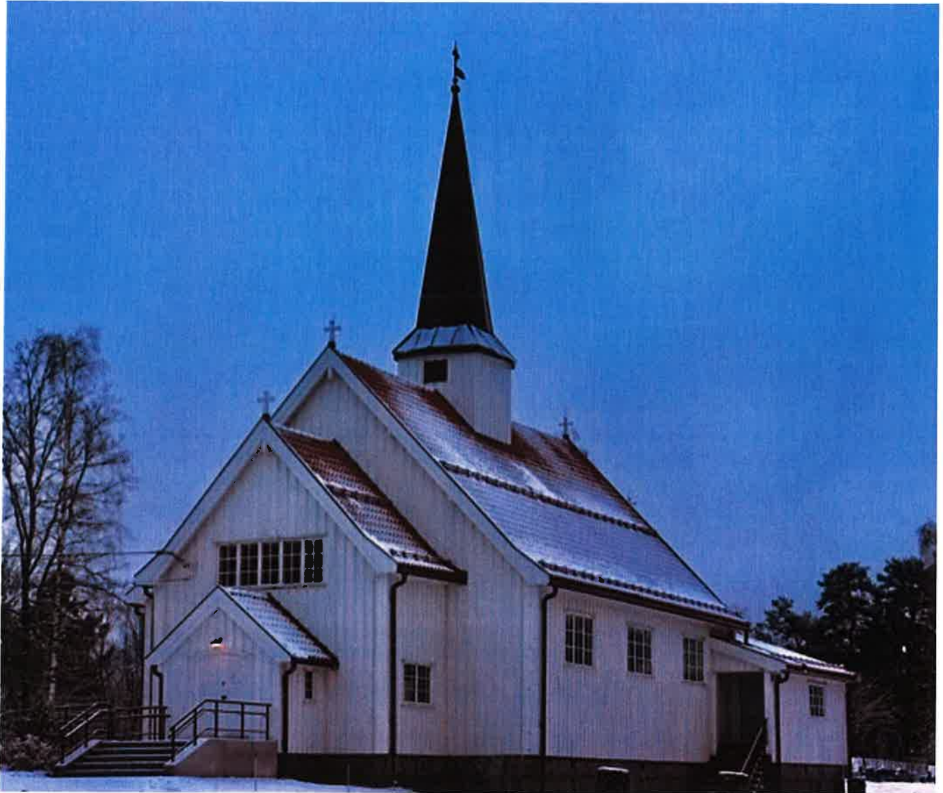
Forsidebilde: Gjøfjell juli 2020