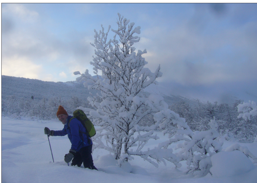
Prosten på skitur utenfor preparerte løyper.