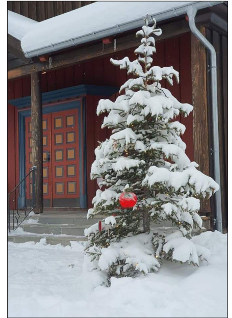
Håpets tre med lys og pynt