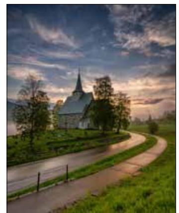
Slidredomen blir en flott plass for jubileum og fredsgudstjeneste den 29. juli 2023.

Nå har jeg stor fornøyelse av å lese om jubileet i 1923 i gamle utgaver av avisa Valdres. Det var flere tusen som møtte fram. Været var ikke det beste, men taler og sanger var det mange av. Biskopen skulle også langt om lenge holde sin tale, men referatet forteller at han ordnet det på en annen måte.