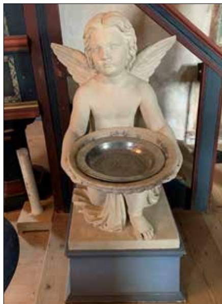
Dåpsengelen av Ole Fladager