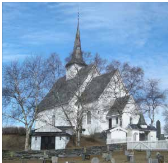
Ulnes kyrkje med bårehus

https://www.norske-kirker.net/home/oppland/ulnes-kyrkje/