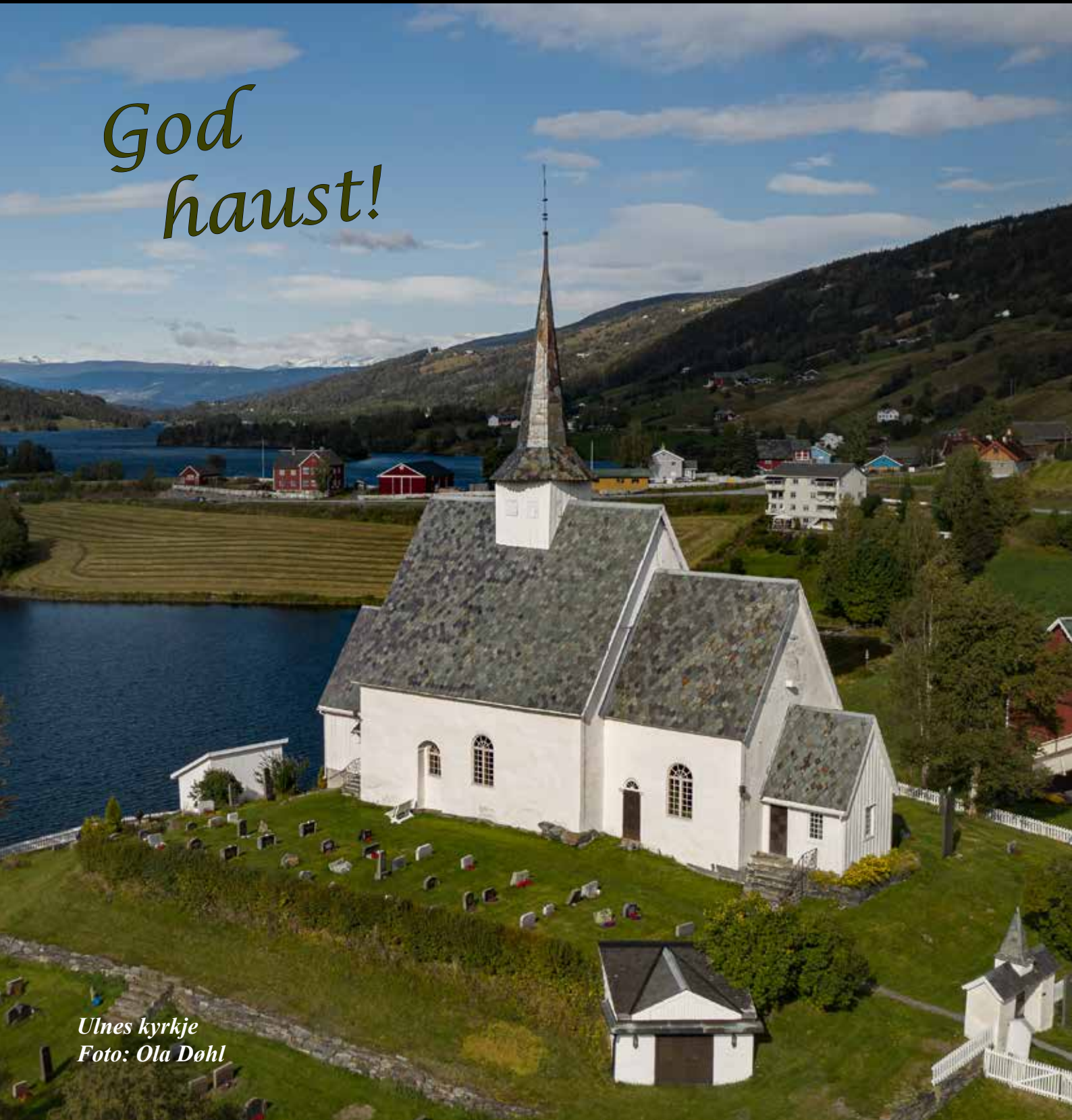
Ulnes kyrkje