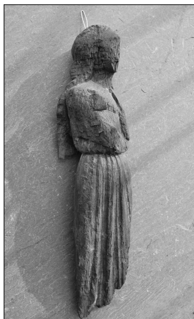
Den vesle kvinnefiguren (Maria?) i tre er blant sporene fra den gang Ulnes kyrkje hørte inn under Den katolske kirke.

De vi ser i dag hadde ingen ting med reformasjonen å gjøre. Men, i et glass-skap i våpenhuset er det oppbevart en trefigur, sannsynligvis Maria – en mener at figuren også omfattet en kvinnefigur til, nemlig Elisabeth. Men hun er borte. Denne kan ha stått i det som gjerne kalles et Maria-skap fra middelalderen.