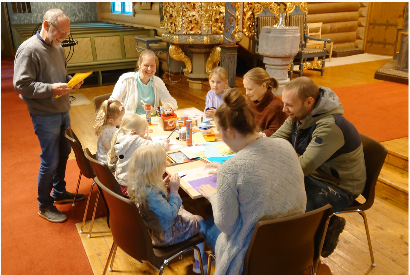
Fra 4-årssamling i Kvam i høst