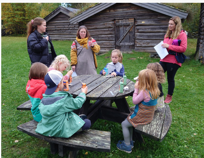
5-åringene på Bygdatur i Sødorp