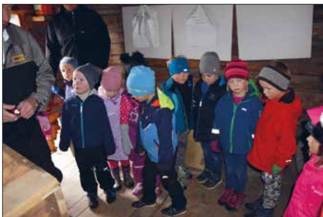
5-åringane i Sødorp i Kvennhuset ved Sula.