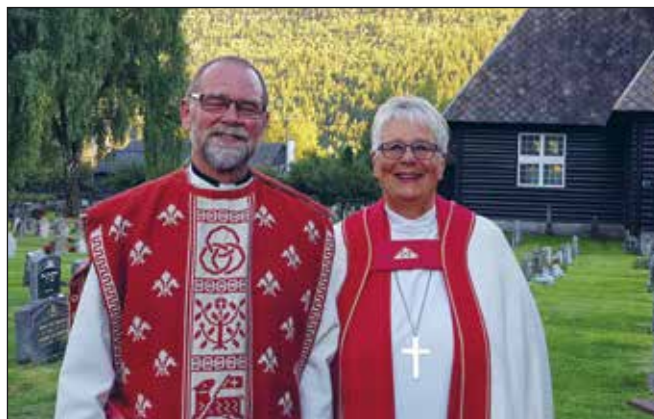
Biskop og sokneprest – glade og nøgde etter ei fin gudsteneste i kapellet