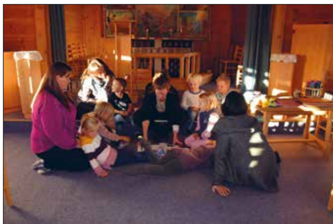
4-åringane i kapellet etter skattejakt rundt ikring – for å bli kjent med kyrkjerommet.