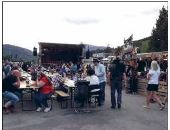
Frå Countryfestivalen, der kyrkja var representert med eiga campingvogn for kaffeservering og samtalar.