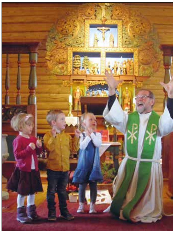
Fra hausttakkefesten med 4- og 5-åringane i Skåbu.