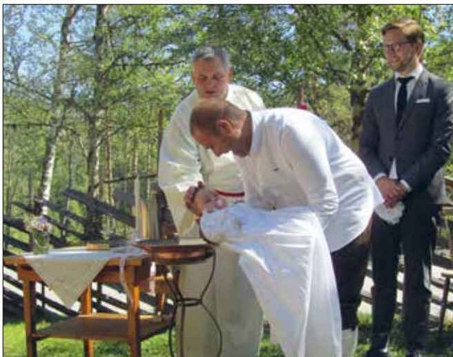
Også denne sommaren var det dåp i Bakkestugu!

TAKK! Takk også til dykk som kom inn som gode hjelparar på musikkida på messene våre denne sommaren!