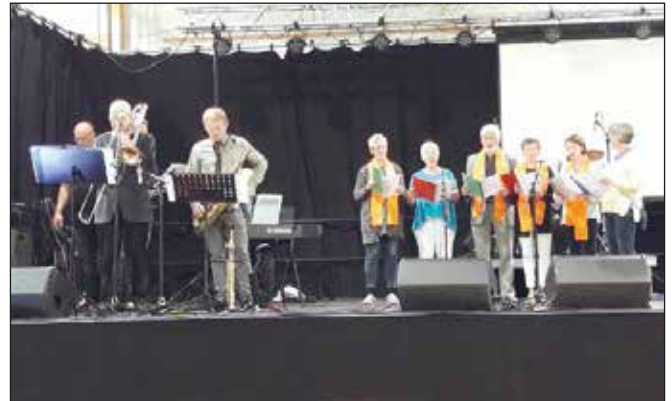
Dei orange skjerfa som songarane nyttar, kjem til å bli brukt under TV-innsamlinga i år.