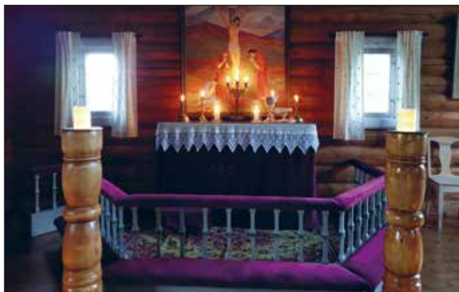
Kapellet innvendig – merk: Altarring og antependium er heilt ny i fiolett føyel.