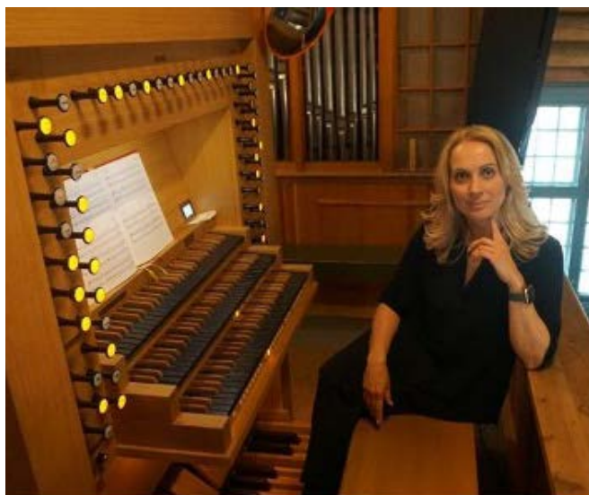
Iren på orgelkrakken i Sødorp kyrkje