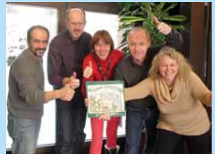
Ski menighet er en grønn menighet side 4