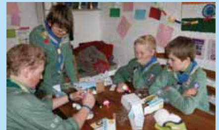
Vi presenterer: Speiderne i Ski nye kirke side 3