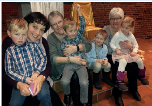
Yngel 30 år side 3