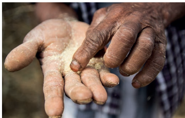
Den knusktørre jorda gjør det umulig å få avlinger som kan selges videre på markedet.