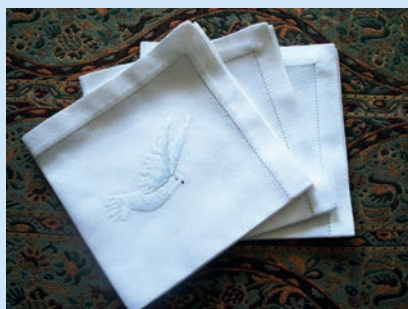
Dåpsserviettene som brukes i menighetene.