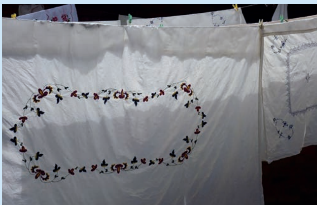
Mønsteret virker kjent fra norsk porselen.