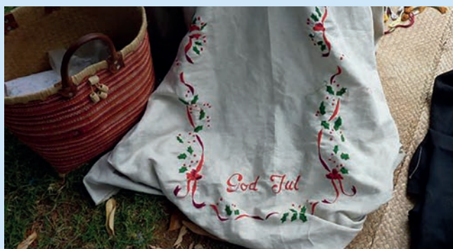
Dette er nok en duk for det norske markedet!