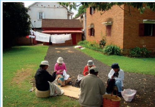
Dåpsservietter fra Madagaskar side 4