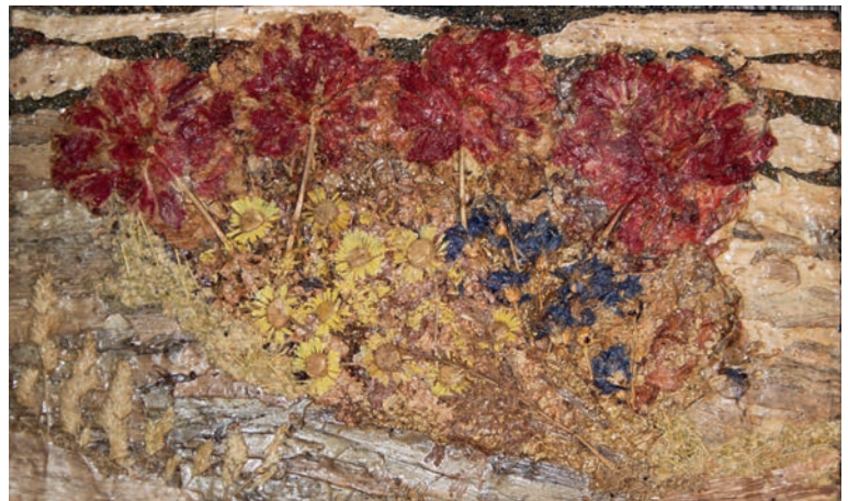
Laget i 1977. Teknikken var ikke så langt utviklet