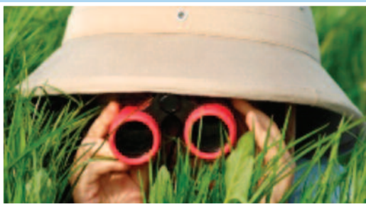
Agenter i farta Side 5