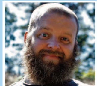
Trosopplærer'n Side 11