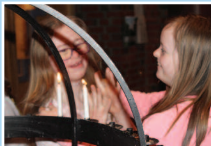
Tro og lys-klubben Side 3