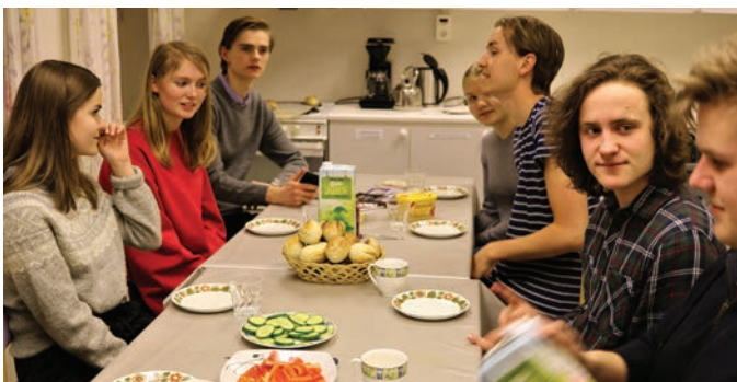
SportY-samtale over kveldsmat