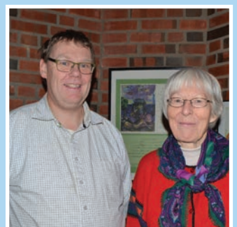
Er du helt grønn? Se side 12