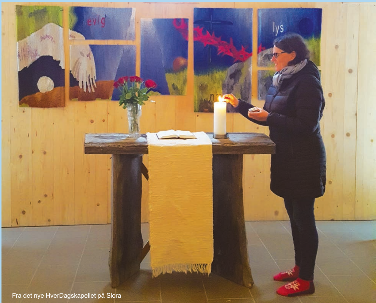
Fra det nye Hverdagskapellet på Slora

Vi heier på fasten, påsken og skaperverket!