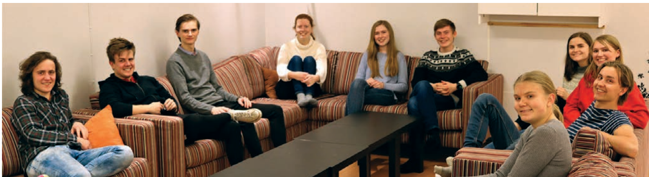
SportY-gjengen i sofa

Ski SportY er et samlingssted for ungdommer i ungdomsskole- og videregående alder i regi av Ski og Kråkstad menigheter, tilknyttet Norges KFUK-KFUM.