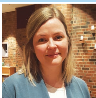
Ny sokneprest i Kråkstad Se side 4