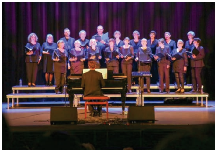
Opptreden i Rådhussteateret i Ski