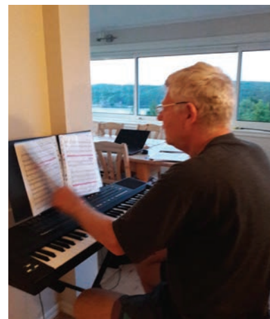
Noen forbereder seg skikkelig