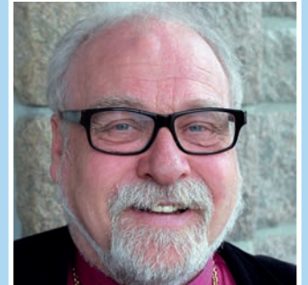
Bispevisitas Se side 8