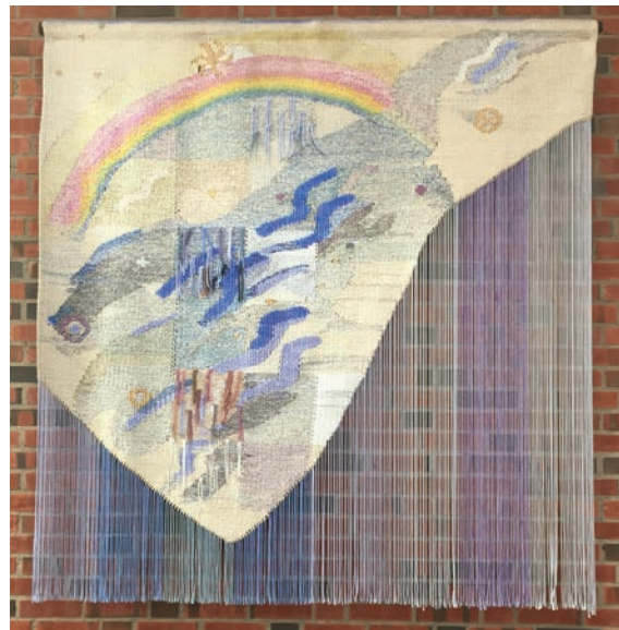
Veggteppe mot sør