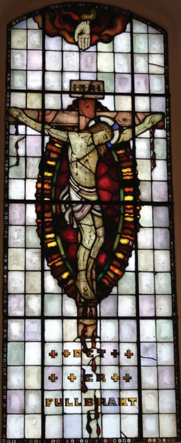
Bilde av glassmaleri fra Kråkstad kirke.