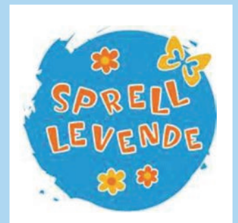
Vil du begynne på søndagsskolen? Se side 10