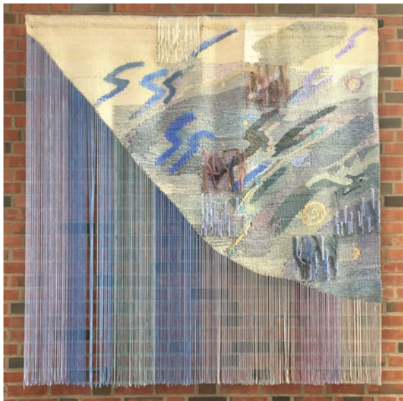
Veggteppe mot nord

(Mye av informasjonen i denne artikkelen er hentet fra heftet «Guide til Ski nye kirke» som du finner i en veggholder inne i kirkerommet, like innenfor inngangsdøren. Der kan du lese enda mer om kirkekunsten.)