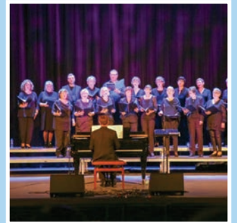
Lyst til å synge i Skimix? Se side 12