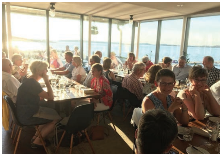
Velsmakende middag ved sjøen i Lysekil