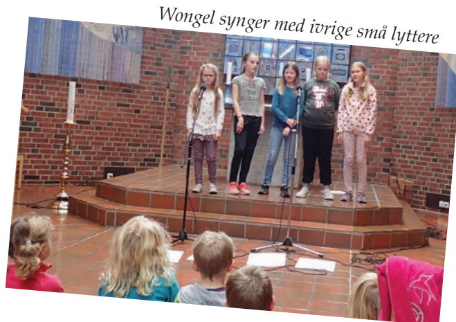
Wongel synger med ivrige små lyttere