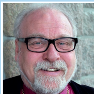
Bispevisitas Se side 6