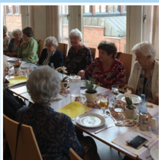
Hobbyklubben jubilerer Se side 4