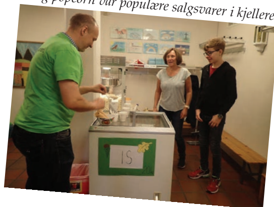
Is og popcorn var populære salgsvarer i kjelleren