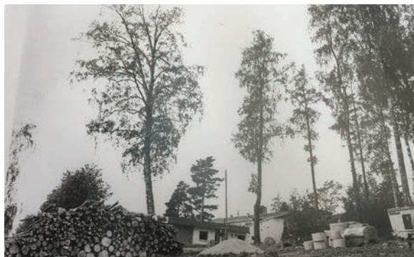
Birkelunden ryddes for kirkebygg