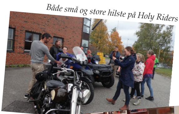
Både små og store hilste på Holy Riders