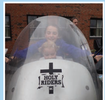
Ski menighets høstfest Se sistesiden