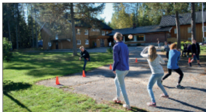
Mange uteaktiviteter på Sjøglimt, som ligger like før Ørje i Østfold på vei mot Sverige.