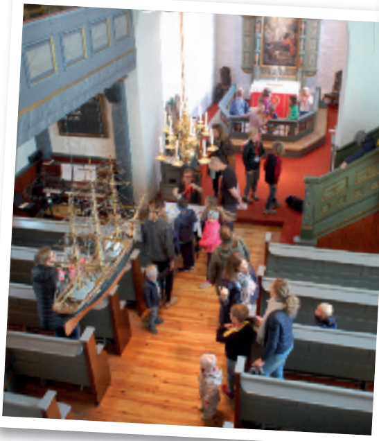
20 nye tårn- agenter klar for å løse mysterier i Ski middel- alderkirke. De skal bokstavlig talt følge fotavtrykk på gulvet...