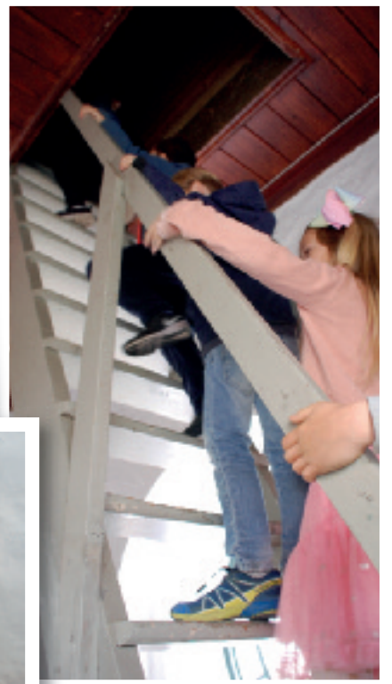
Litt skummelt og veldig bratt opp trappen til klokketårnet, er de fleste enige om. Men nedenfor står «englevakter» og passer på!