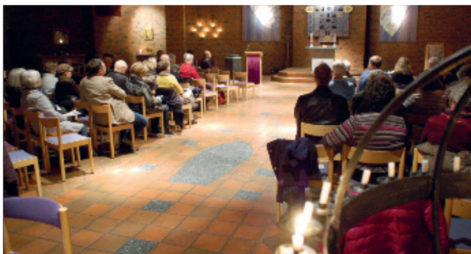
Omlag ett tusen mennesker var innom fastesamlingene i Ski nye kirke.