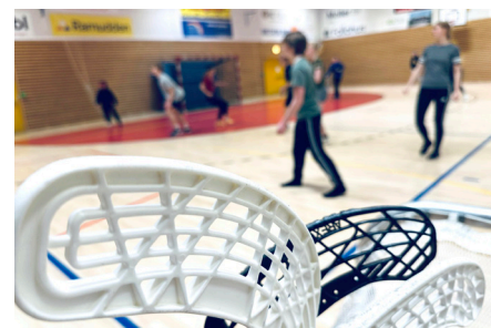
Høy innsats på den månedlige Sportykvelden i Kråkstadhallen. Og etterpå er det taco.