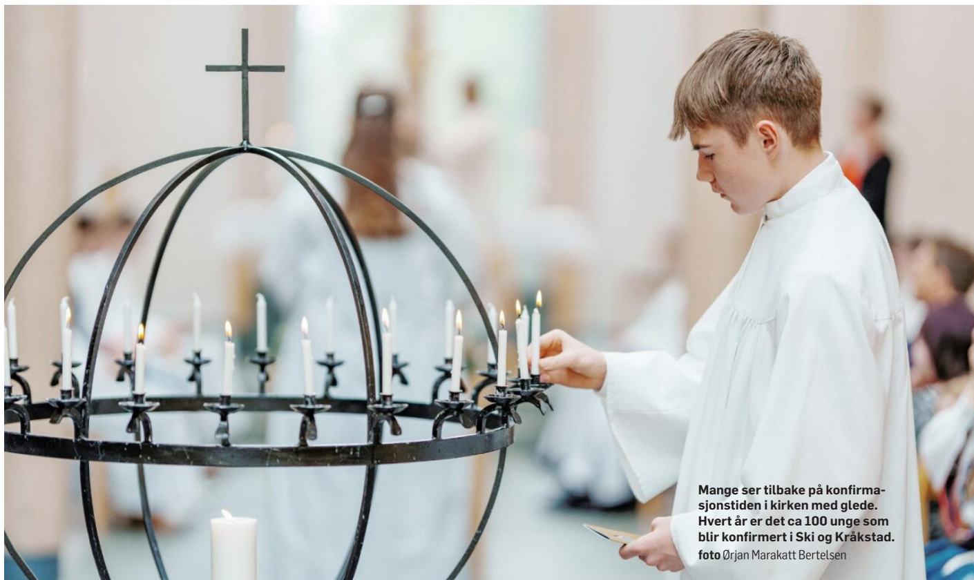
Mange ser tilbake på konfirmasjonstiden i kirken med glede. Hvert år er det ca 100 unge som blir konfirmert i Ski og Kråkstad.

➡ det året du fyller 11 år. Vi skal være lys våken i kirken, lete etter lys i mørket og spise god mat sammen.