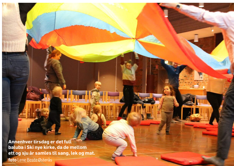
Annenhver tirsdag er det full baluba i Ski nye kirke, da de mellom ett og sju år samles til sang, lek og mat.

1-2 p: Er du på besøk og har tyvlest menighetsbladet?