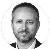
4. mars Bård Vegar Solhjell