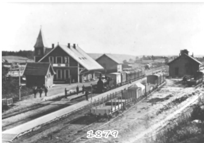
Ski stasjon da den ble åpnet i 1879.

Ski Mek. Verksted; Menighetshuset; Pinsekirken Salen; sprengstoffabrikken på Drømtorp, Bankplassen/Vinklgården, og i forrige utgave handlet det om de første husene i Nordbyveien.