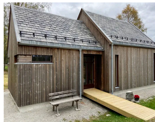
Ikke glem at HverDagskapellet på Slora alltid er åpent. Der finner du fred og ro.