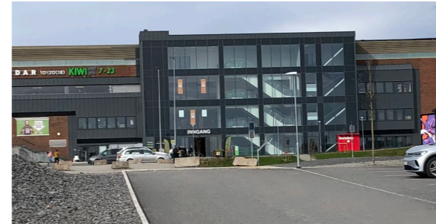
I 1990 flyttet Skeidar til det som er dagens møbelbutikk i Norbyvegen.