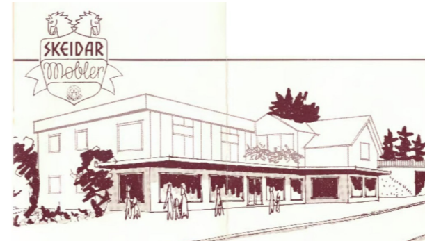
Etter oppstarten av møbelforretningen i 1964 var det stadig utvidelser i Åsveien 3.

sprennstoffabrikken på Drømtorp; Bankplassen/Vinklgården; de første husene i Nordbyveien og historien om Ski stasjon. Deretter handlet det om Ski sykehus; Vanaheim; Magasinparken og i forrige utgave skrev vi om Mallagården, som har mange navn.