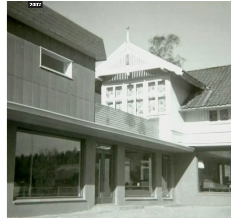
Da ekteparet Andresen startet møbelbutikk i Åsveien 3, utvidet de hjemmet til butikk.