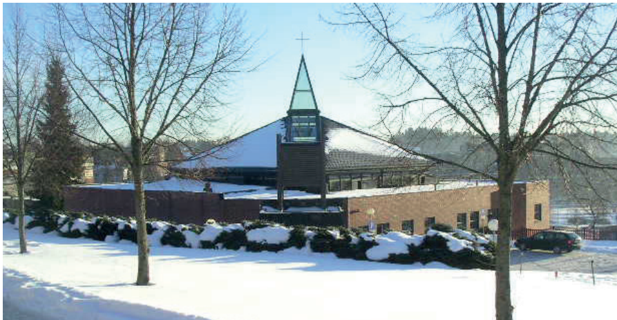
I kirken i Ski og Kråkstad har vi fulle kirker til jul. Men i år er mye usikkert.