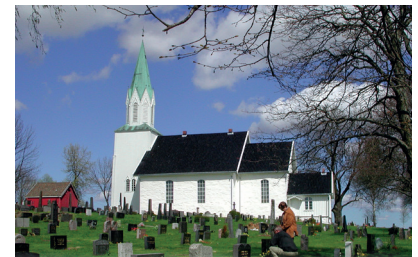
Du kjenner nok igjen kirken, men spørsmålet er: Hvor gammel er den?