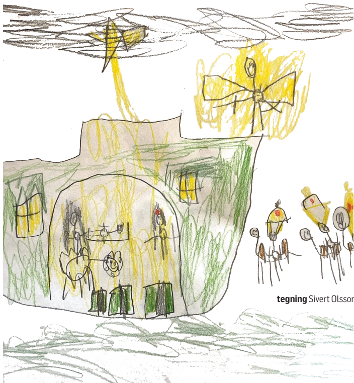
tegning Sivert Olsson Haugstad (7 år)