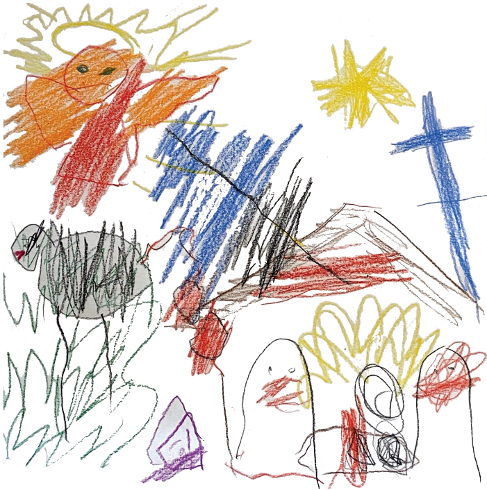
tegning Brage Olsson Haugstad (4 år)