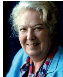
Ingrid Bjoner ble født i Kråkstad 8. november 1927, men hva er hun kjent for?