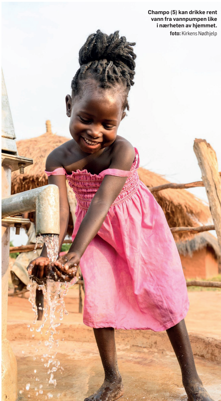
Champo (5) kan drikke rent vann fra vannpumpen like i nærheten av hjemmet.