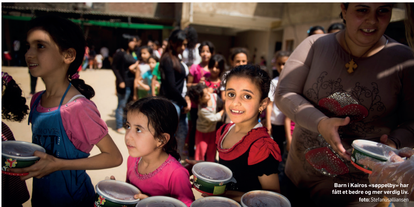
Barn i Kairos «søppelby» har fått et bedre og mer verdig liv.