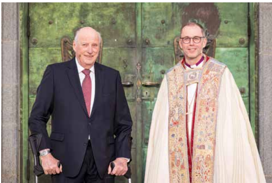
Med kongen