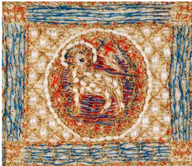
Lam på bispekåpe.

Den observante leser ser at headingen på forsiden er endret. Denne er scannet fra menighetsbladet i mai 1948, og er en litt lysere og triveligere versjon.