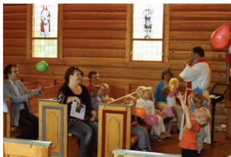
Gry Barnehage er på bursdagsfest