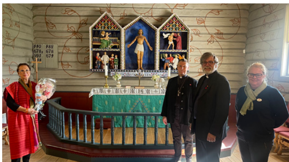
Oppstad kirkes nye antependium ble innviet i gudstjenesten den 10.09.. Det er laget av kunstneren Inger Fladby Thinn.