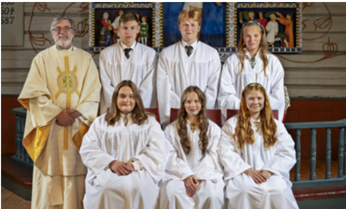
Konfirmanter i Oppstad kirke 24. september 2023.