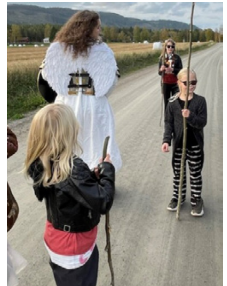
Englebesøk under pilgrimsvandringen

Det ble en spennende vandring til Mo kirke. Sammen fant barna flere sport etter en engel som hadde vært der, og da vi nærmet oss kirken møtte vi til og med engelen Mikael som beskyttet oss mot en landeveisrøver! Da vi kom frem, var det Mikkelsmesse med vakker musikk i kirken.