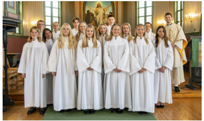
Konfirmanter i Sand kirke 03. september 2023.