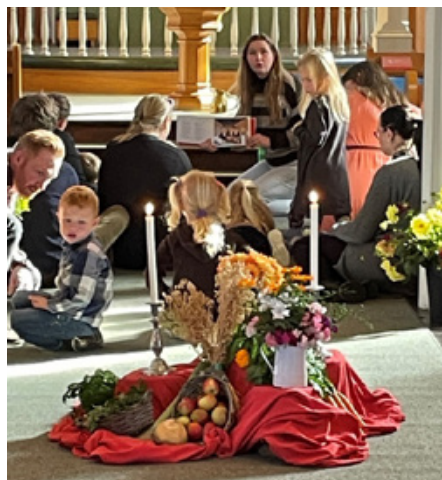
Utdeling av 2 årsbok og 4 årsbok under høsttakkefesten i Mo kirke.