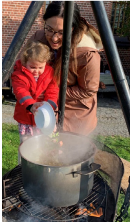
Grønnsakssuppekoking til høsttakkefesten i Strøm kirke.

gjemt blant all høstpynten. Etterpå gikk vi ut i strålende sol og spiste deilig grønnsakssuppe, som 4-åringene hadde laget før gudstjenesten startet.