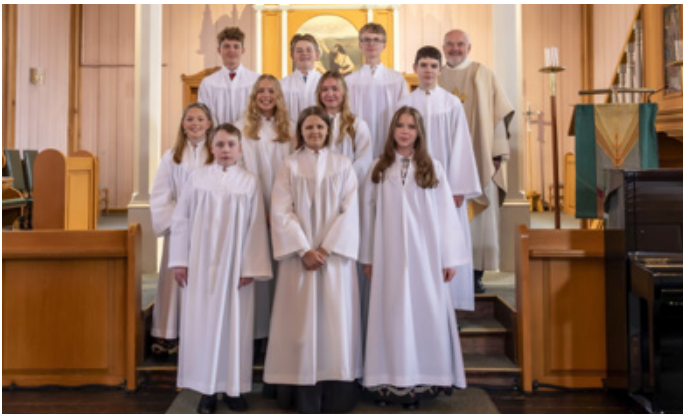
Konfirmanter i Mo kirke 10. september 2023.