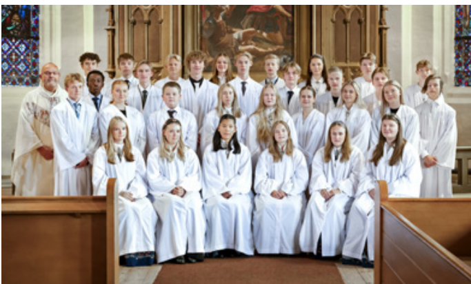
Konfirmanter i Strøm kirke, konfirmert den 17. og den 24. september 2023.