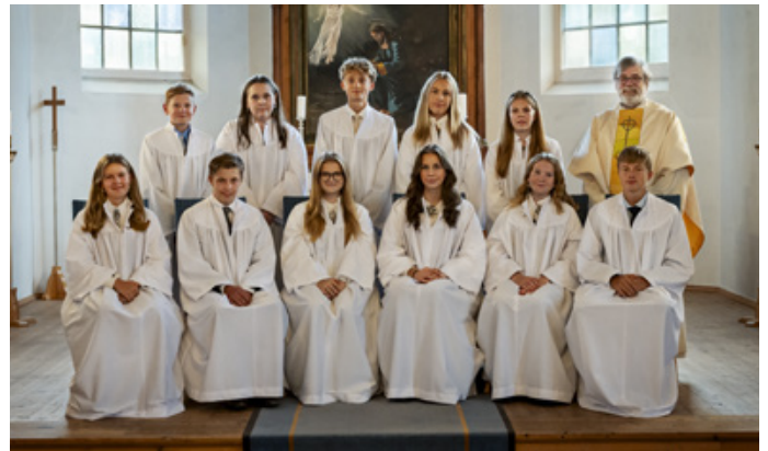
Konfirmanter i Ullern kirke 17. september 2023.