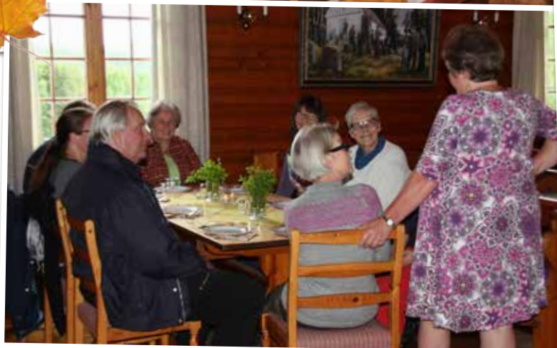
En liten diskusjon.