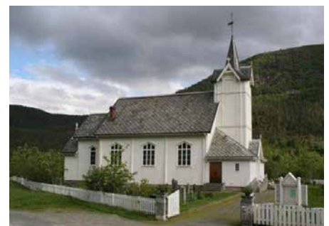
SNILLFJORD KIRKE Krokstadøra 176, 7527 Krokstadøra