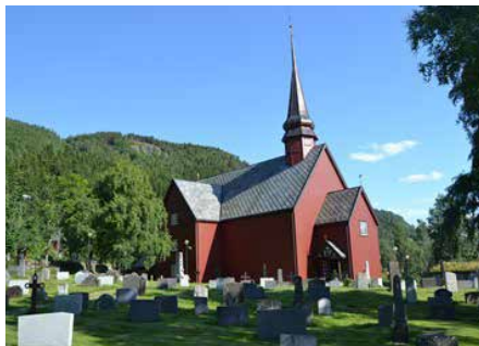
MELDAL KIRKE Ressveien 31, 7336 Meldal