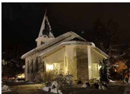
ORKANGER KIRKE Kirkegata 2, 7300 Orkanger