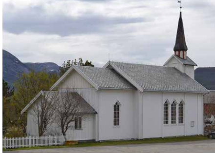
AGDENES KIRKE Værnesveien 1418, 7318 Agdenes