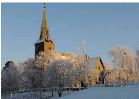
ORKDAL KIRKE Kjerkvegen 14, 7320 Fannrem