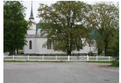
LENSVIK KIRKE Lensvikveien 435, 7316 Lensvik