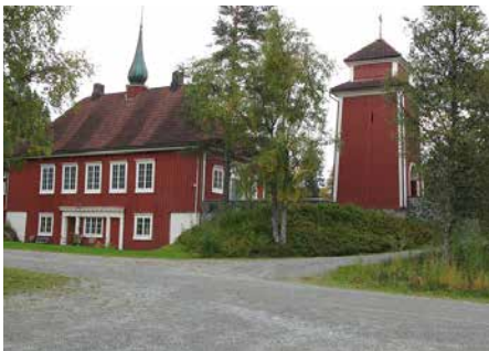
LØKKEN KIRKE Bjørnliveien 239, 7332 Løkken Verk