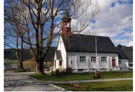
DEN GODE HYRDES KAPELL Njardar gate 41, 7300 Orkanger