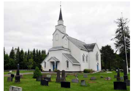
MOE KIRKE Orkdalsveien 1661, 7327 Svorkmo