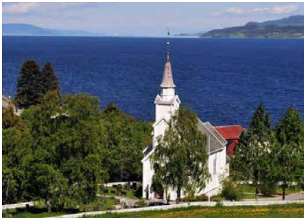
GEITSTRAND KIRKE Ilflatvegen 12, 7300 Orkanger