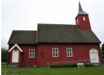
INGDALEN KIRKE Ingdalsveien 202, 7316 Lensvik