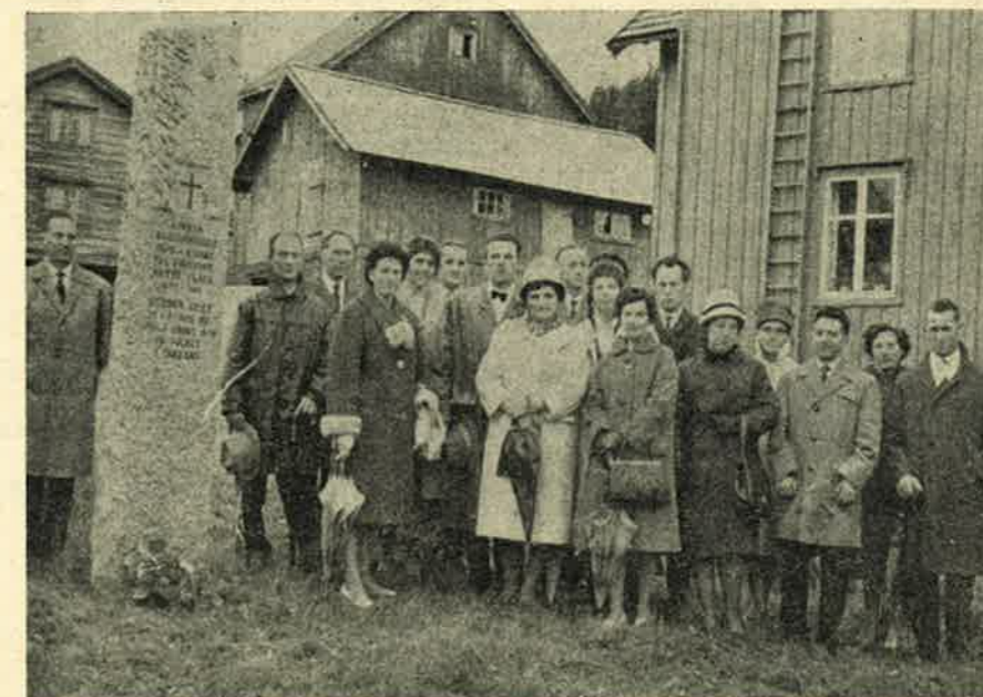
Litt sent kommer det, men vi tar likevel med dette bilde som ble tatt ifjor da konfirmantene i Orkland fra 1938 var samlet til sitt 25-års jubileum på Svorkmo 29. sept. Stedet er ved minnestøtten for den gamle verkskirken der oppe.