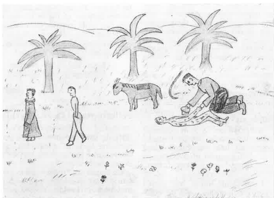
Den miskunnsame samaritan.

Men 25 års konfirmantane er også invitert til alle gudstenestene og samværa. Det er blitt stor interesse omkring desse samlingane.