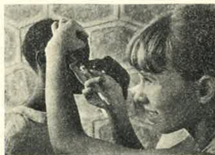
Nødhjelp 77 — Takk for hjelpa!

Om nattverden står det i dette eld-gamle skriftet: «På Herrens dag skal dere komme sammen, bryte brødet og holde nattverd, etter at dere først har bekjent deres overtredelser. Slik vil deres offer være rent. Men la ingen som ligger i strid med sin neste delta i samværet før de er blitt forliket, så ikke deres offer skal bli vanhelliget.» Når det er snakk om «offer» siktes det rimelig- til s. 11