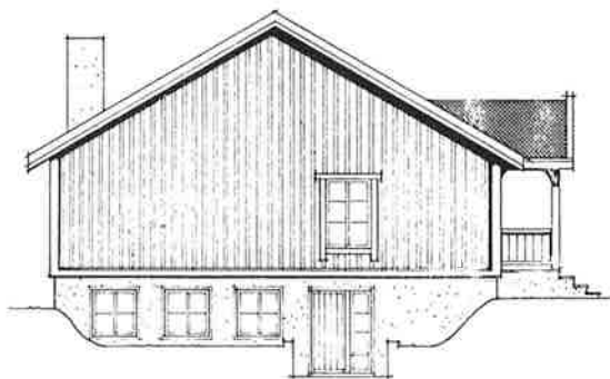
Fasade mot Orkdalsveien

I dette nummer av menighets- bladet har vi derfor lagt inn en giroblankett. Vi håper at du vil bruke den og hjelpe oss å reise Orkanger menighetshus.