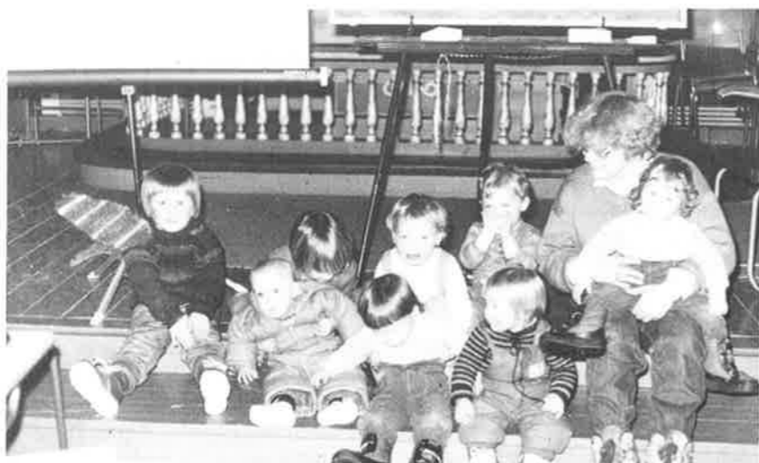
Bildet viser et glimt fra barneparkeringa 10. februar.

Som mange sikkert vet har det ei tid vært barneparkering under deler av høymessene i Orkdal kirke. Fire ektepar som selv har småbarn, har tatt på seg ansvaret for dette. Barneparkering er et tilbud til småbarnsforeldrene, som skulle gjøre det lettere for dem som har små barn i familien, til å komme seg til gudstjeneste. Før siste