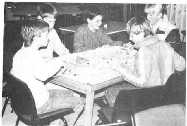
Bordtennis er populært.