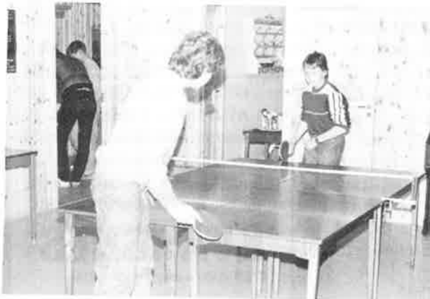
Blir det mål tro?

Menighetsbladet trenger din gave. Husk giroblanketten i dette nummer.