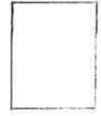
Målfrid Kvile kasserer