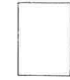
Sissel Haugnes kasserer