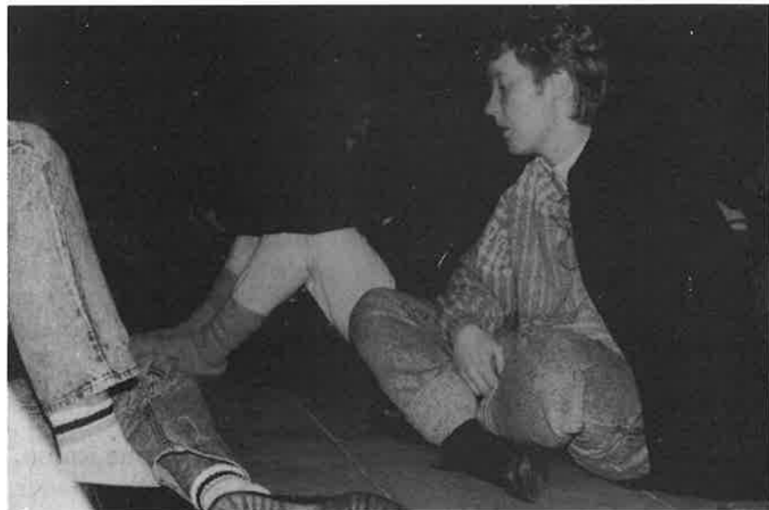
Deltagere fra Orkdal på gudstjeneste.