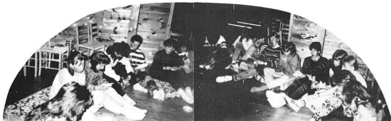
Korssamling lørdag kveld