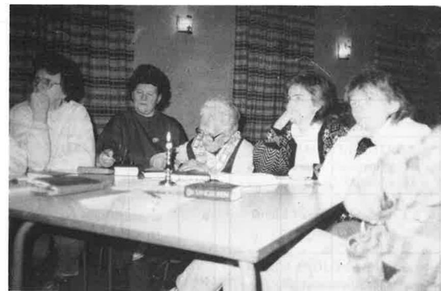
Mange deltok aktivt i planleggingsarbeidet for møteaksjonen. "Dette lover me- get bra", sier medlemmene i aksjonskomiteen.

ikke er villig til å la noe viktig vike for noe som er enda viktigere. Og for det tredje rett og slett latskap og makelig- het. Dette er noe hver enkelt må job- be med framover. Ta en viljebeslut- ning og be og arbeide for at vi alle fin- ner vår nådegave/plass i den planlagte aksjonen.