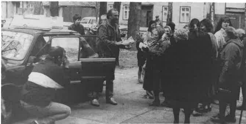
Storbred frå Orkdal sine bakerier gikk unna «som varmt hvetebrød».

Vi var 13 stykker i reisefølget, frå ulike plassar, med ulik bakgrunn og tilhørighet. Bussen var fullasta med klær, sko, flatbrød, knekkebrød og storbrød. Bussen forlot Orkdal torsdag kveld og var framme i Estland laurdag morgon. Vi