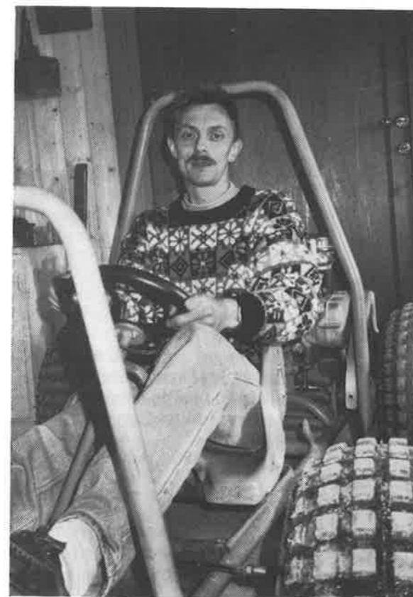
To av lederne i Cross-roadklubben på Fannrem i hver sin bil.

cross-kart, mekking, trafikkteori og samlingsstund. Og noen ganger er det mest kos med god mat og prat. Klubben har i dag 4 kjøretøyer, såkalte junior-crosskarter, til bruk for barn og ungdom i alderen 8 - 14 år.