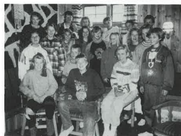
Konfirmantene i Orkland menighet.