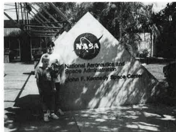
Kennedy Space Center