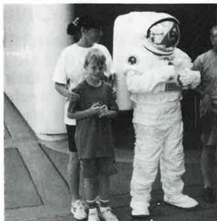
Kennedy Space Center

Vi merket ikke noe til kriminaliteten i Florida. Vi tok heller ikke spesielle forholdsregler, annet enn at