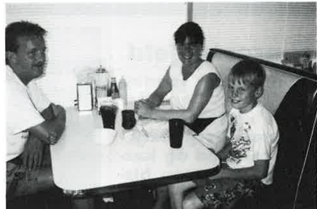
Frokost i Amerika

Ettertiden medførte et hav av gratulasjoner, blomster og gaver. Vår dag hadde ikke blitt den samme