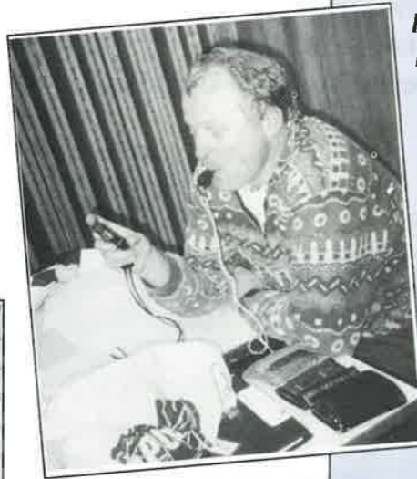
Turneringsleiar var Atle Ølstørn.