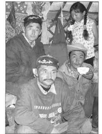
På besøk i Mongolsk gehr.

Samme dag traff vi to fiskere ved elvebredden. De var begge pastorer. Far og sønn. Farens kone var den første kristne i moderne tid i Mongolia, i 1990! Historien hennes var at ho var sjuk og søkte hjelp mange steder. Så ble ho møtt av Legens lege, Jesus. Ho var nå bibelskolerektor på den skolen NLM samarbeider med. Det ble et svært spennende møte. "De fattige har en spesiell plass i Guds hjerte, sier pappa pastor, "samtidig har vi en visjon om å nå de som har innflytelse i samfunnet. Derfor spiller jeg ishockey og fotball med generaler". "Jeg har etablert en menighet i sentrum", sier sønnen, "vi ønsker å rekruttere advokater og andre i høyere stillinger". "Vi satser på familievekkelse", sier far. "Vi må nå idrettsfolk", fortsetter han,