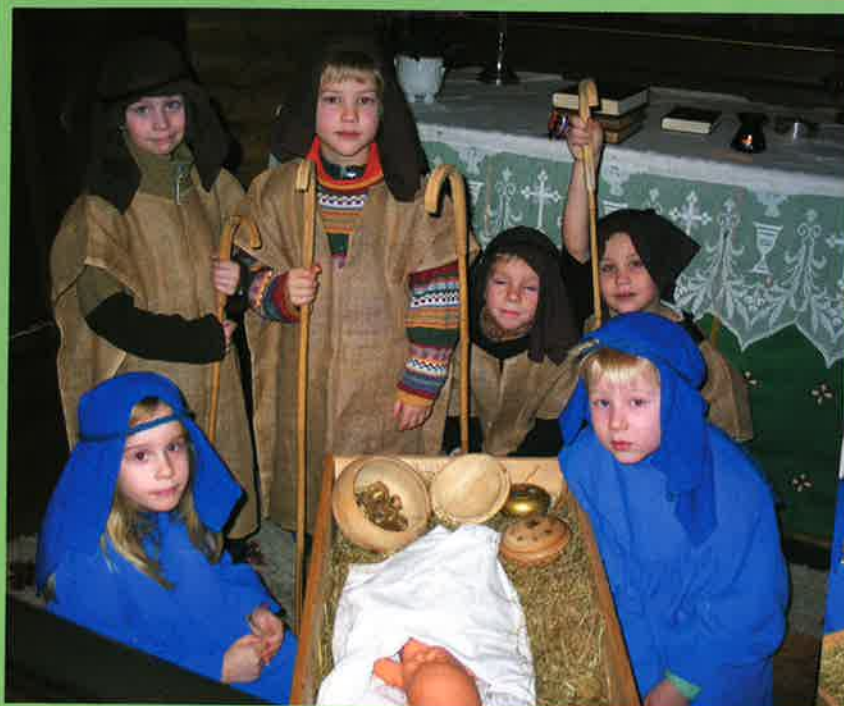
Julevandring i Orkanger kirke jula 2003