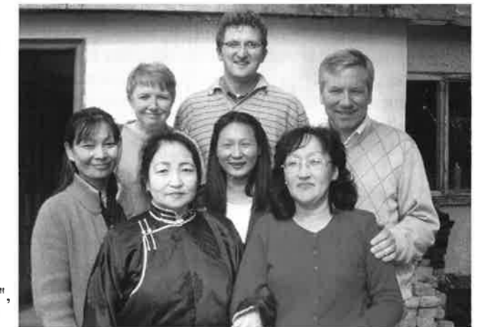
Kursledere og deltagere i Darhan.