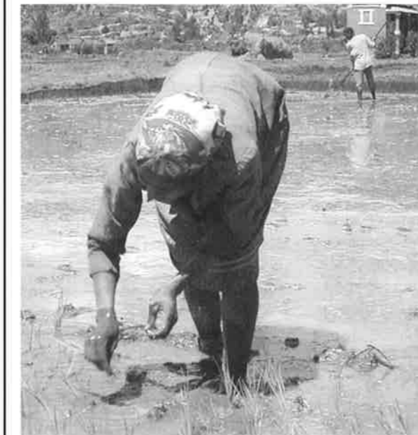
Risplanting foregår for hånd og er kvinnearbeid