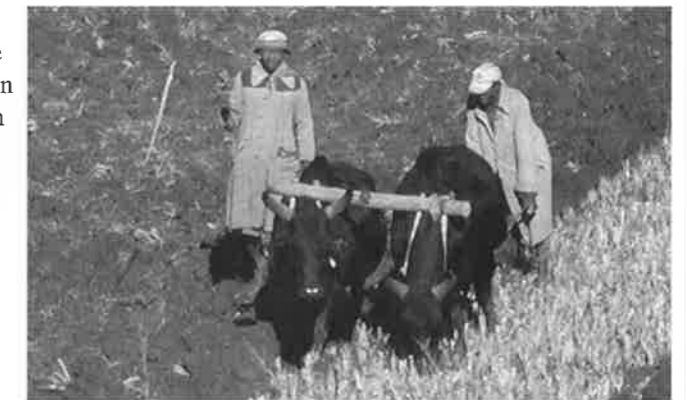
Heldig er den som har et oksepar til hjelp i pløyinga!

mulig. Hun er utdannet sivilagronom og er en dyktig dame som vi har stor tro på at skal kunne lede prosjektet på en god måte i tiden som kommer.